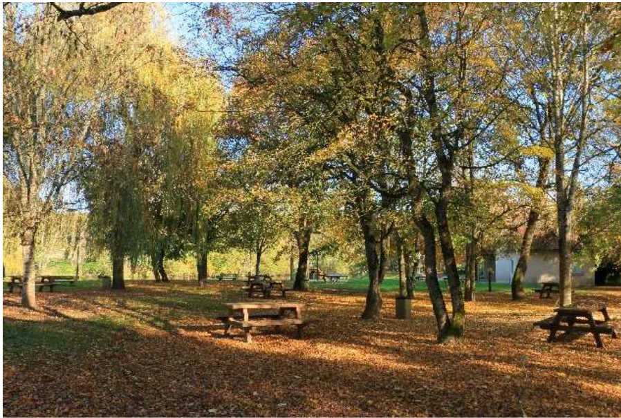
Partie ombragée avec tables à proximité des bâtiments de restauration