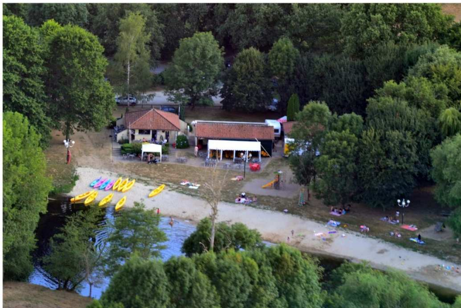
Vue aérienne des bâtiments de l'aire de loisirs (bar – restaurant – poste de secours)